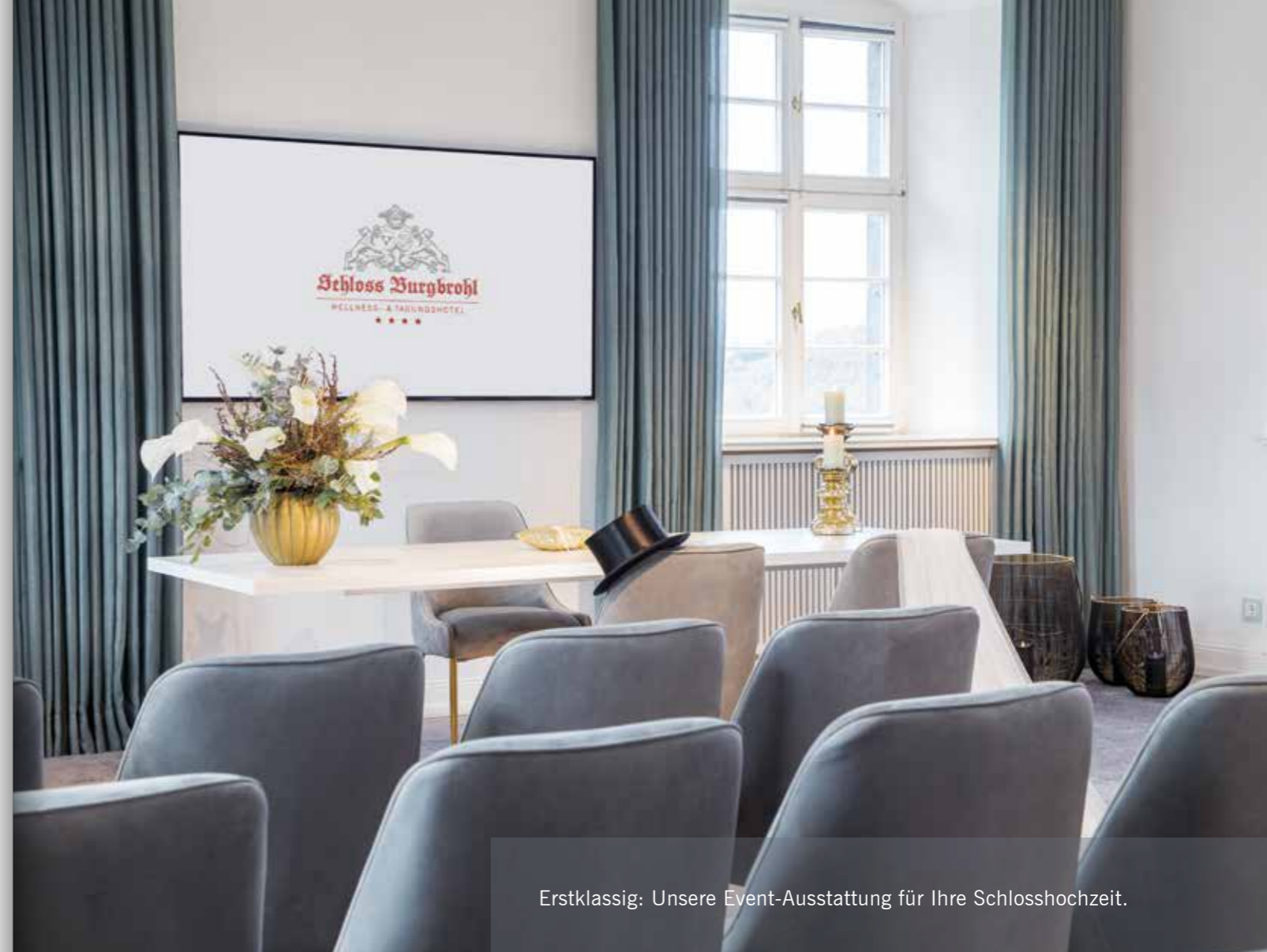
Erstklassig: Unsere Event-Ausstattung für Ihre Schlosshochzeit.

Setzen Sie den schönsten Tag Ihres Lebens ganz individuell in Szene. Mit der exklusiven Anmietung des Schlosses und/oder der herrschaftlichen Schloss Villa sorgen wir für einen ganz privaten Rahmen und pure Exklusivität. Ungestört, umsorgt und ungezwungen feiern Sie im Kreis von Familie und Freunden.