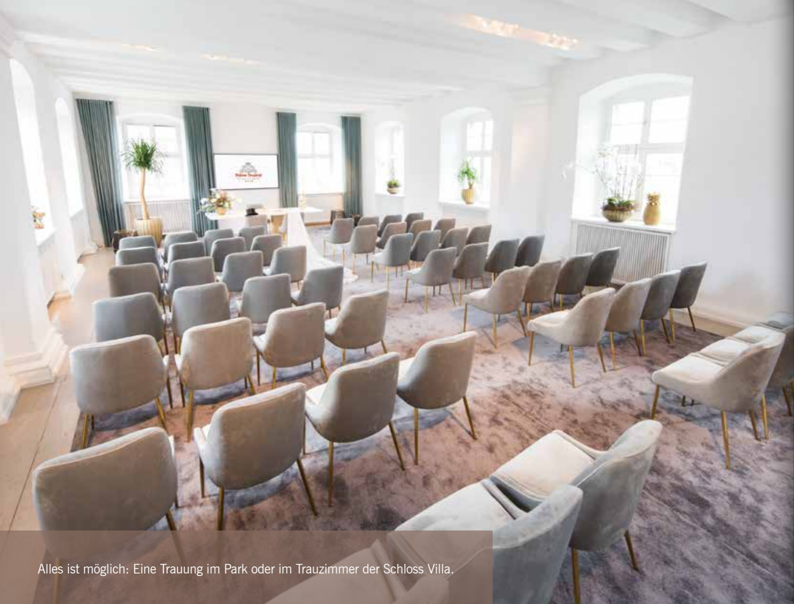
Alles ist möglich: Eine Trauung im Park oder im Trauzimmer der Schloss Villa.