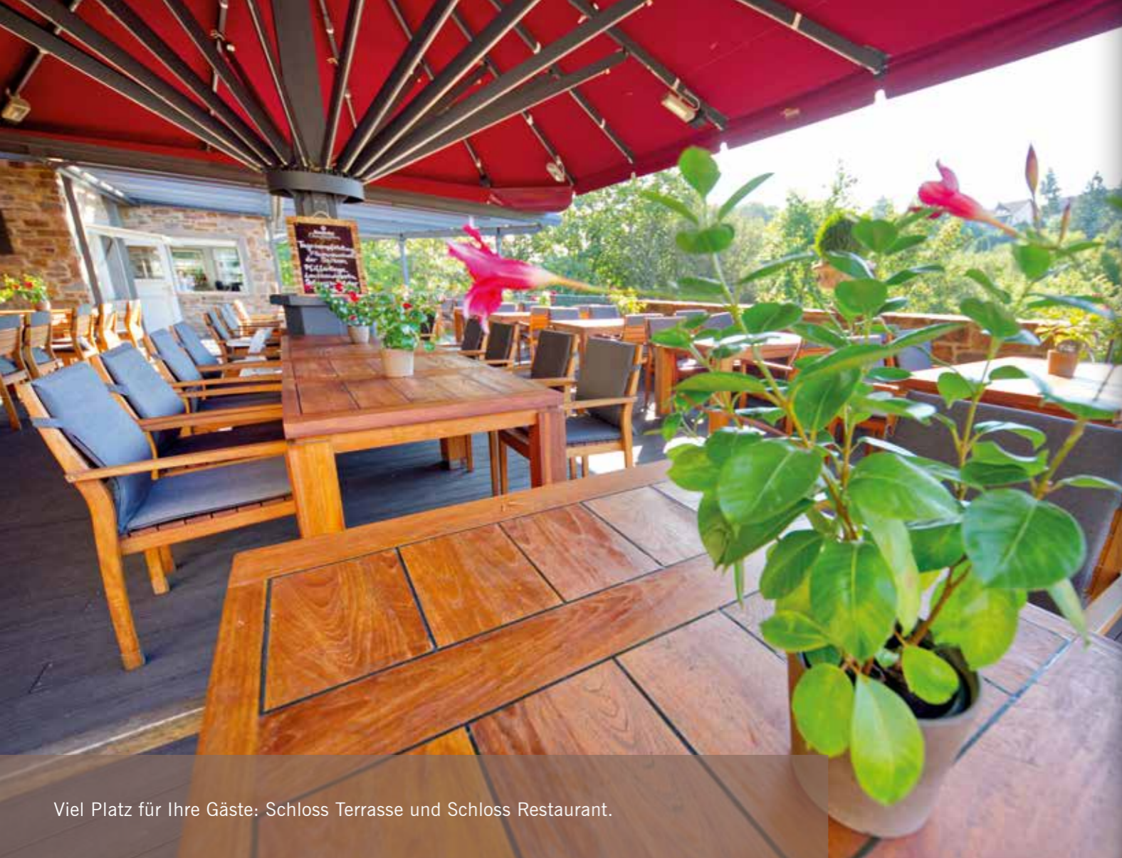
Viel Platz für Ihre Gäste: Schloss Terrasse und Schloss Restaurant.