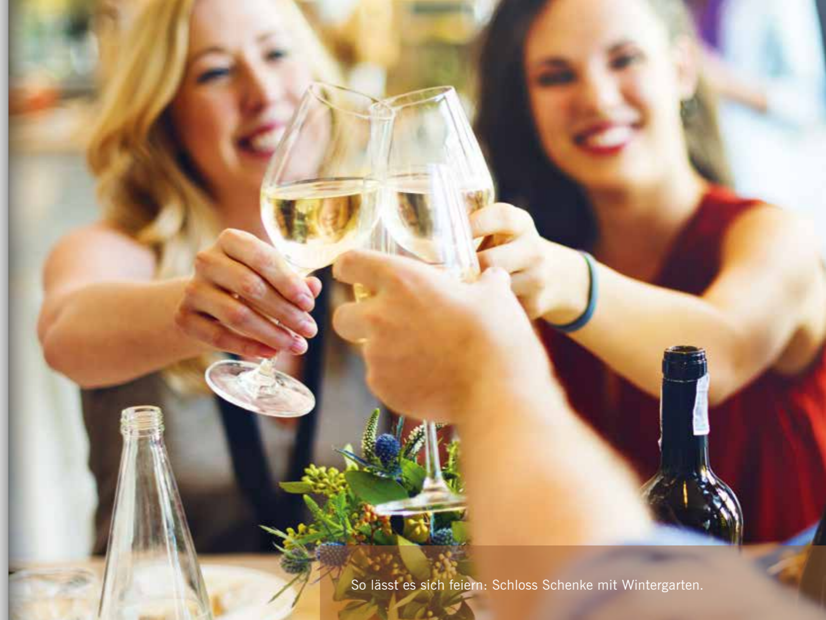
So lässt es sich feiern: Schloss Schenke mit Wintergarten.

Schloss Schenke und Wintergarten sind als Eventlocation auch zusammen buchbar.