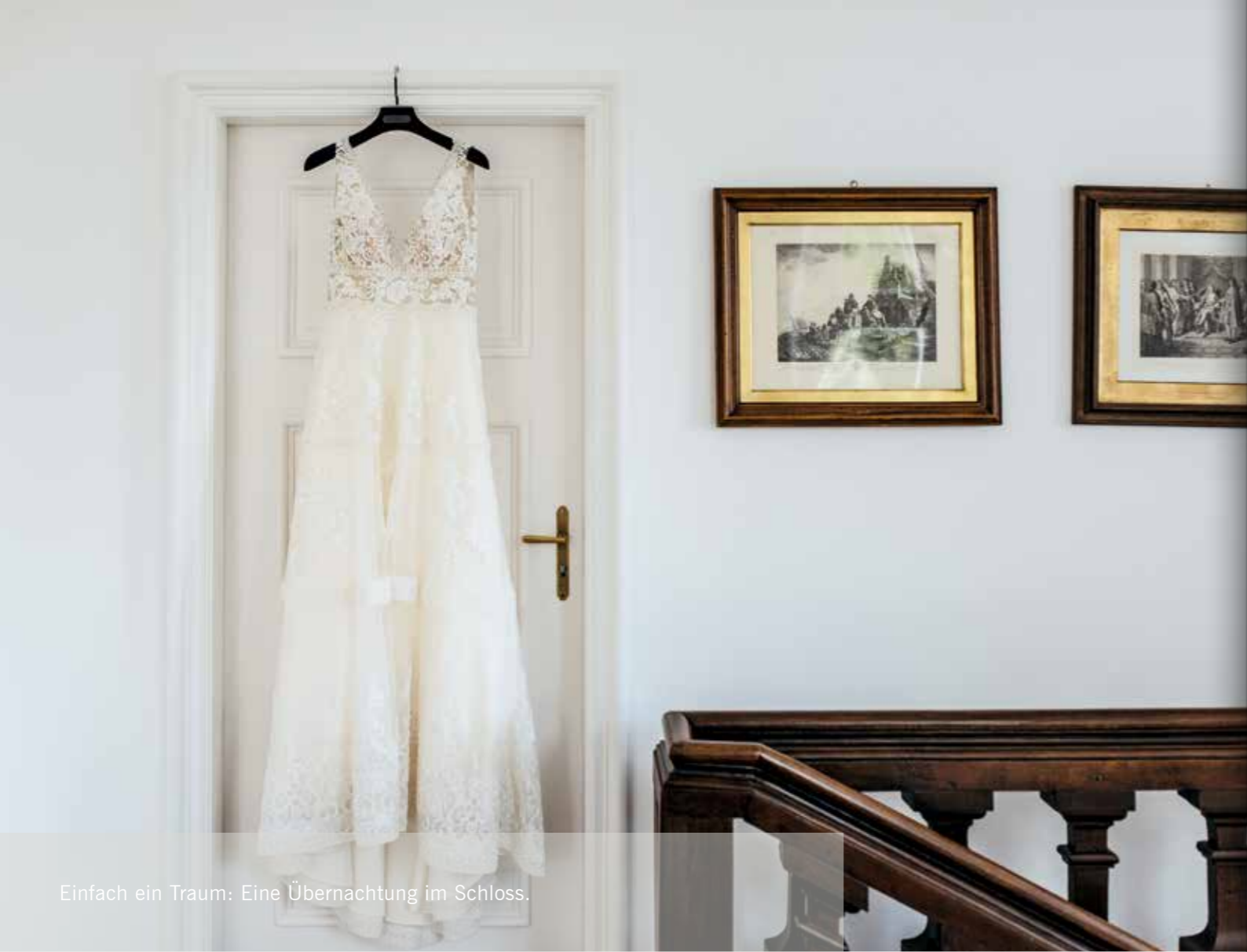
Einfach ein Traum: Eine Übernachtung im Schloss.