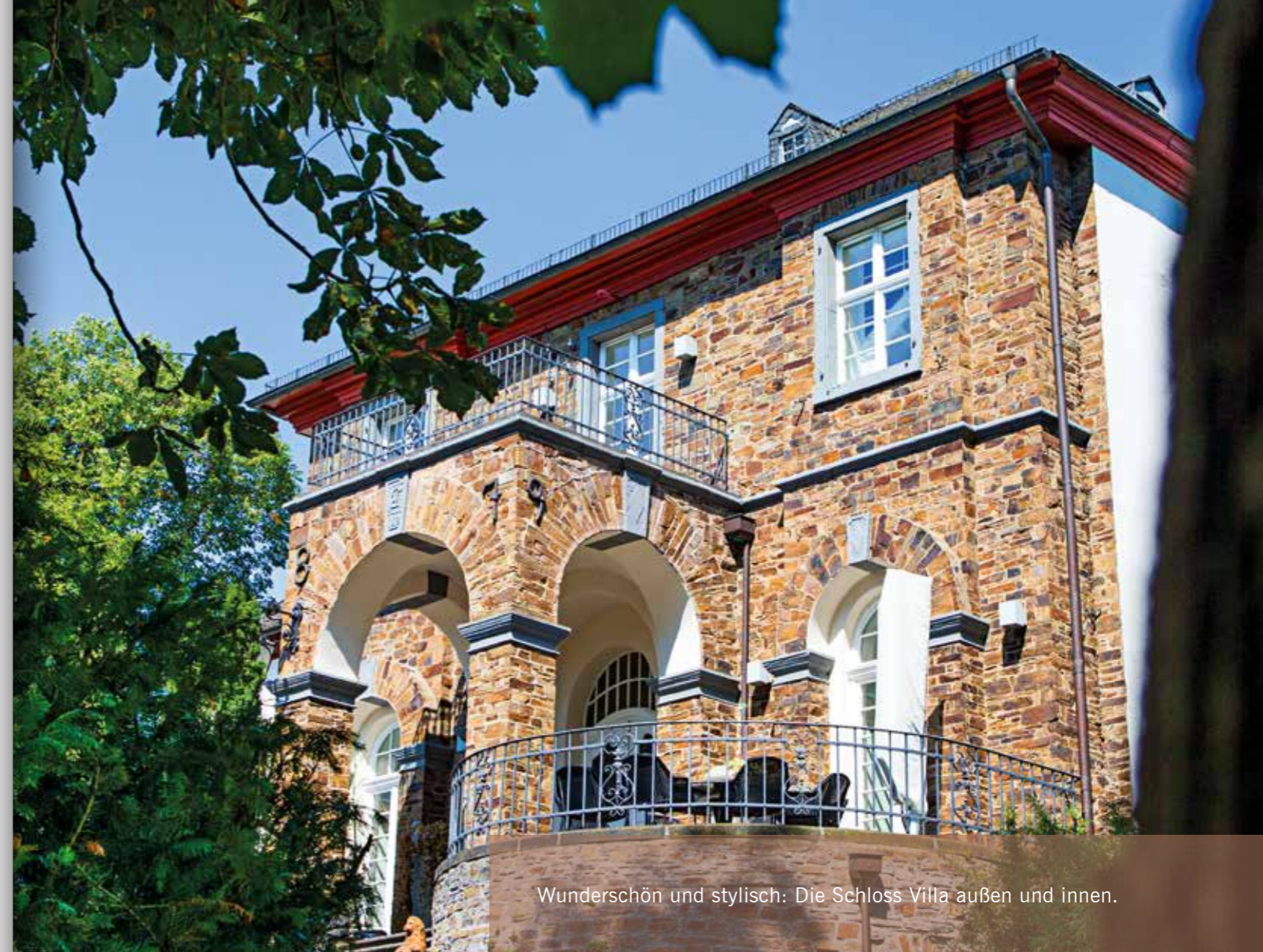
Wunderschön und stylisch: Die Schloss Villa außen und innen.

Ideal für eine Hochzeit im Frühjahr und Sommer.