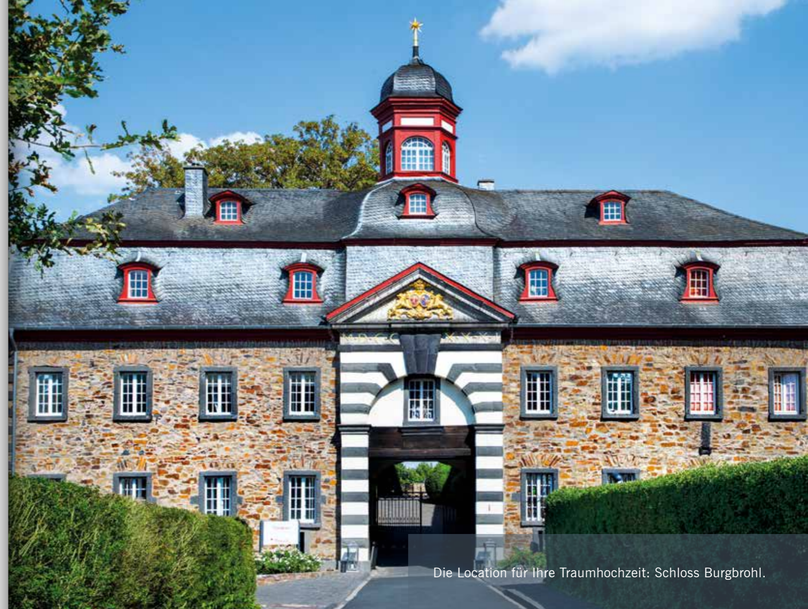
Die Location für Ihre Traumhochzeit: Schloss Burgbrohl.